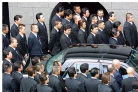
Yakuza - preman elite Jepang. Acara pemakaman boss Yakuza Yamaguchi-gumi di Kobe.